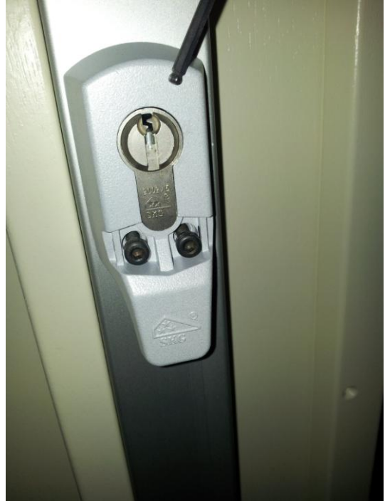
10. Cilinderhuis monteren, inbusboutjes vast draaien