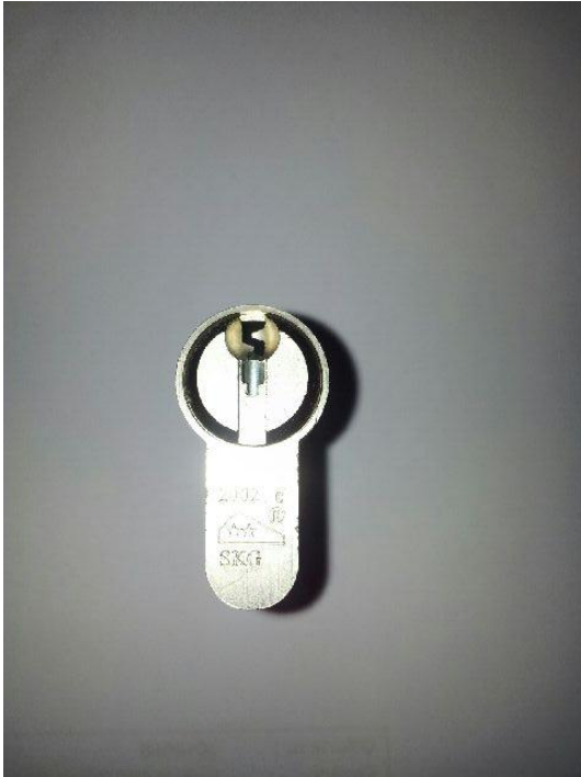
5. Neem een halve cilinder 30/10