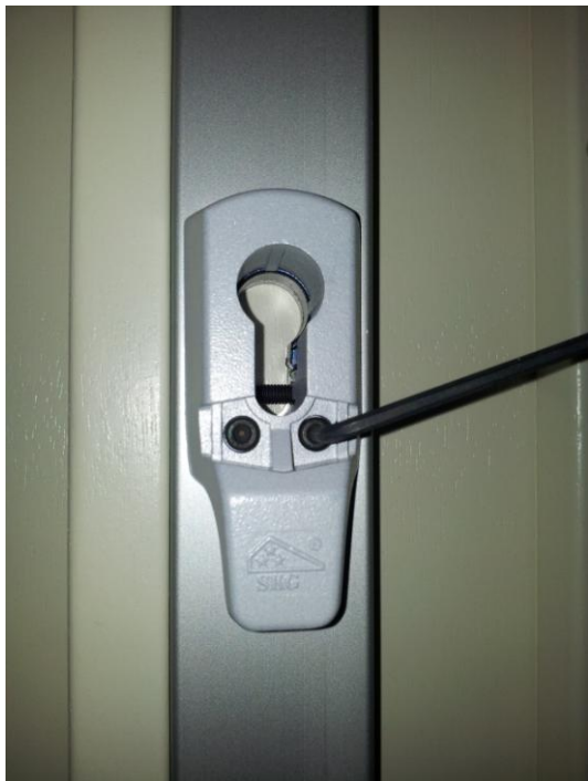
3. Inbusboutjes los draaien en cilinderhuis verwijderen