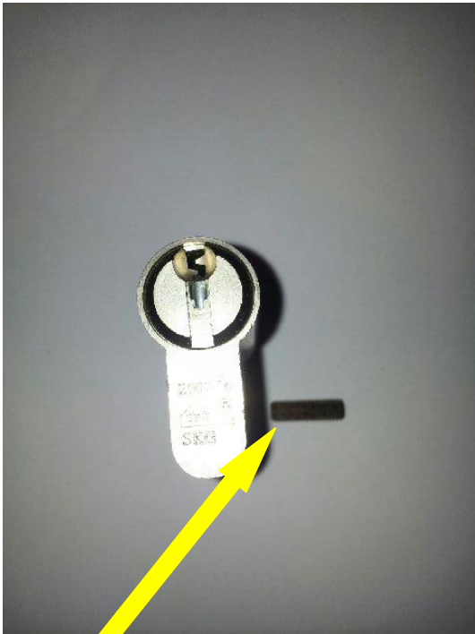
7. Het boutje wat uit het cilinderhuis gekomen is, in de cilinder draaien