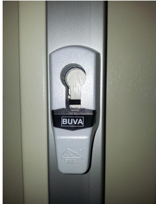
2. Zwarte plaatje met opschrift "BUVA" verwijderen