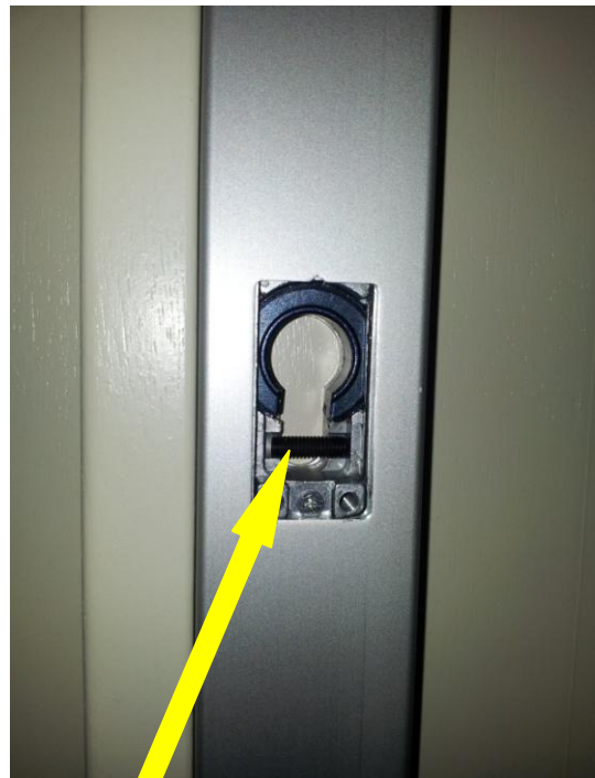
4. Het zwarte boutje wat er horizontaal in ligt verwijderen ( niet weggooien)