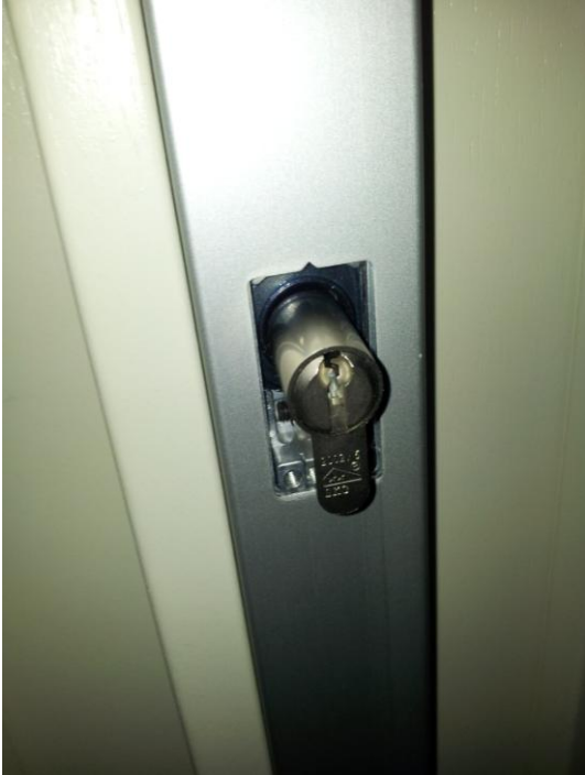
9. Cilinder er in "hangen"