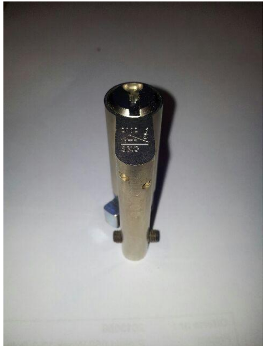
8. Cilinder is klaar voor montage